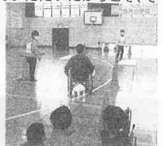
「先生も体験させていただきました」

また、別の日には社会福祉協議会の方に来ていただき、車いすの体験も行いました。体験後に「自分で操作するよりも押しもらったほうが楽だった。困っている人がいたら押し