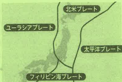
【日本列島周辺のプレート】