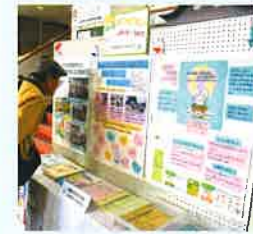
公民館まつりにて

●公民館祭りにて、南地区民生委員児童委員の活動紹介の展示に加えて、新しく「ほっと・ホット・Hot」Caféをopenし、地域の方同士がふれあえる場を設置し、地域の方の考えにふれる機会とした。