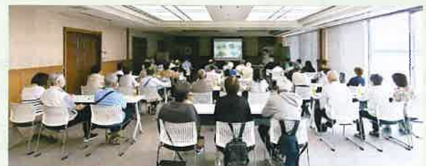
児童福祉専門部会の研修の様子