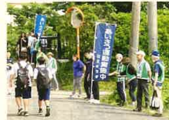
登校時のあいさつ運動の様子

玄関先で庭の手入れをする人や、畑で作業をする人を見かけると「こんにちは、お花がきれいですね」「ご精が出ますね」などと、見知らぬ者どうしでも昔は声を掛け合ったものです。声を掛け合い双方の人柄に触れることで、心が和むなど地域の防犯にもなっていたのだと思います。