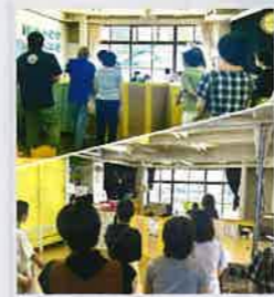
「おおきな樹」の視察