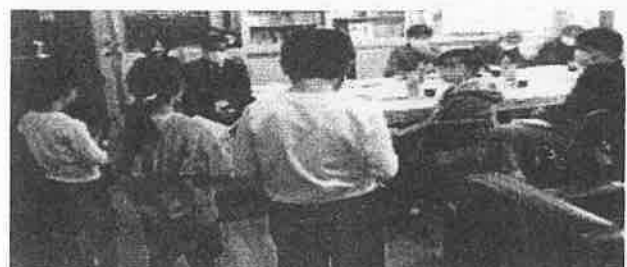
様々な説明を行ってきました。