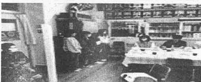
これまで児童代表のみなさんが学校運営協議会で、