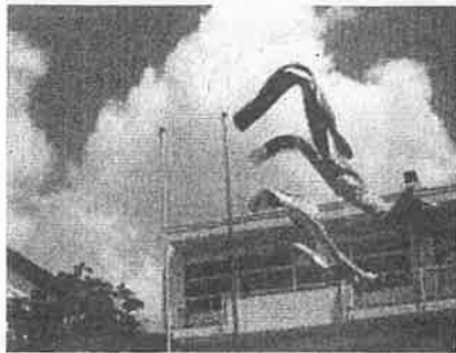
子どもたちの健やかな成長を願ってこいのほりをあげました!

新学期がスタートして2か月ほどがたちました。子どもたちは新しいクラスや友だち、担任の先生など新しい環境にも慣れてきて、いきいきと活動している姿がたくさん見られるようになりました。特に1年生のみなさんが毎朝元気にあいさつをしてくれるのでとてもうれしく思っています。また、登校や下校中に困っている低学年の子がいるとすぐに声をかけて対応してくれたり、校庭や近くの公園のゴミ拾いを率先して行ってくれたりする高学年のみなさんもいるといった話も聞きました。とても頼もしく、そして誇らしく思いました。