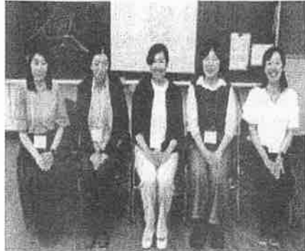
「令和5年度本部役員の皆様、本当にありがとうございました！」

また、令和5年度の本部役員の皆様には本当にお世話になりました。特に、ふれあい祭りの実施に