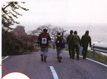
▲寸断された道路を自衛隊員と進む同救護班(石川県珠洲市)