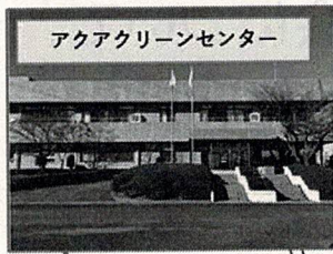
アクアクリーンセンター