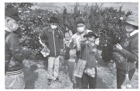
障がい児・者ふれあい交流事業