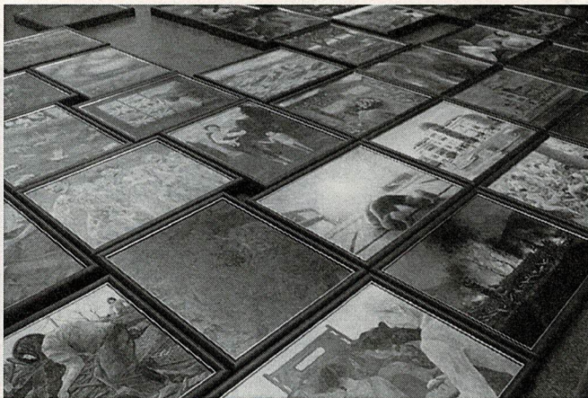
制作された「原爆の絵」

この取り組みは、被爆者が高齢化するなか、被爆の実相を絵画として後世に残すことや、絵の制作を通して、高校生が被爆者の思いを受け継ぎ、平和の尊さについて考えることを目的に行われています。