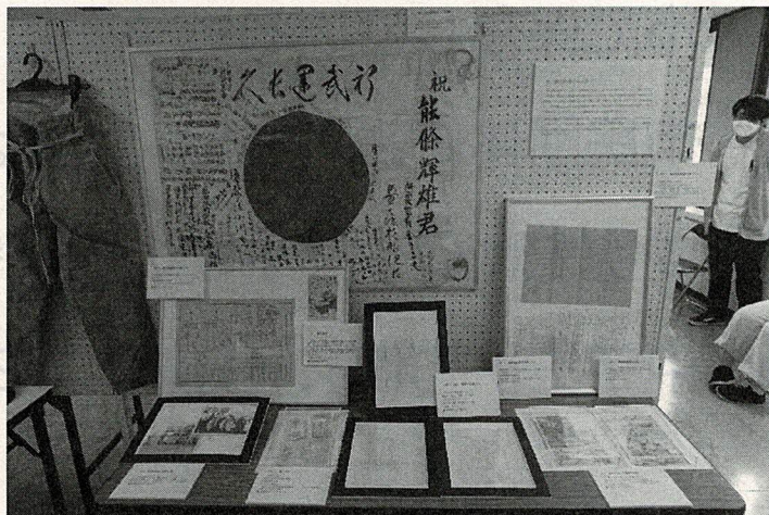
令和4年度「平和を祈念するパネル展示」の様子