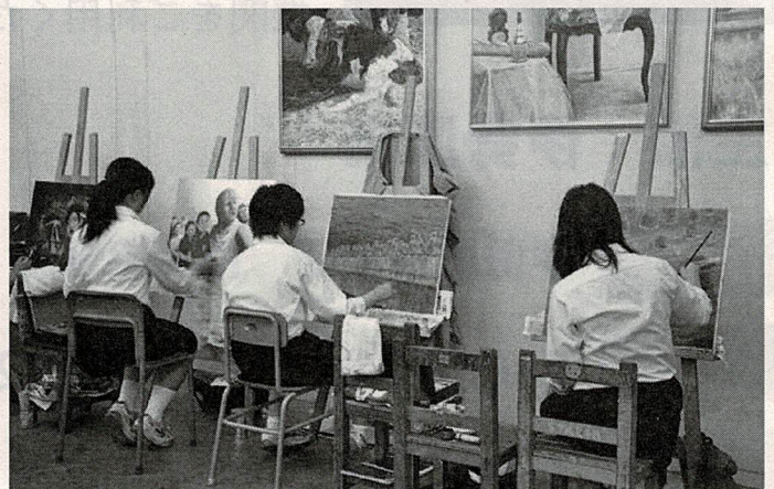
「原爆の絵」の制作に取り組む高校生