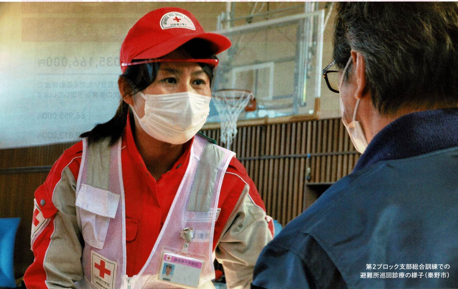
第2ブロック支部総合訓練での 避難所巡回診療の様子(秦野市)