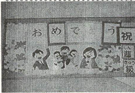
南棟1階のお祝い掲示です。