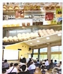
日帰り研修の様子

今年度は感染対策を徹底して、障がい者支援施設「足柄療護園」にて訪問研修を実施しました。施設内の見学こそ出来ませんが、施設の方から障がいに関わるお話や、施設を利用している方のお話を聞かせてもらうことができました。 話を聞いたお一人は「自由な足で戦後の大変な時代を生きてこれたので、力強いお話を心打たれました。もうお一人は、25年前に突然寝たきりになり会話も出来なくなりました。苦難を乗り越え、笑顔で車椅子に乗り「目標を高く持って下さい」と明るく話す姿に涙に励まされ、胸がいっぱいになりました。その後、施設利用者さんが作業をされているスイーツのお店「ふくらん」を訪ねました。購入したプリンは、とても美味しかったです。 私たちはこうした研修を通して、これからは地域の皆さまと障がいを持つ方々の力になれるよう、広い視野を持って活動してまいります。