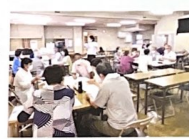
地域の情報を共有しています

コロナ禍で研修の機会が制限される中、成瀬地区では民生委員児童委員制度100周年の活動強化策の一環として、「ナルミンプラン」と名付けたグループ討議を実施してきました。訪問活動や地域活動をする中で、地域の実情を把握し、様々な問題や課題をグループに分かれて話し合ってきました。 さらに令和4年に発表された「神奈川県版活動強化方策(みつける・つなぐ・みまもる)」に基づき、問題や課題にどのようにかわかり、どの機関と情報共有すれば解決につながるか、成瀬地区としての活動のヒントを確認しました。 今後もこのヒントを基に委員同士で情報を共有し、問題の解決に取り組んでいきます。