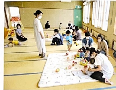
成瀬地区子育てサロン

令和3年度の活動実績は相談・支援活動が合計3,240件あり、分野別では、高齢者に関することが2,115件と一番多く、その他には障がい者に関することが173件、子どもに関することが580件、その他が372件になりました。