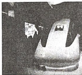
リニアモーターカー見学

1日目は山梨県立リニア試験センターの見学や宿泊先の清泉寮のレンジャーさんの指導のもと自然体験を行い、そこで採集した木の葉を使ったエコバックづくりにも挑戦しました。そして、昨年できなかったキャンプファイヤーのかわりに学年レクを行い、クラスごとに工夫を凝らした出し物(劇やダンスなど)を披露するなど大いに盛り上がりました。2日目は富士山の風穴・氷穴なども見学しました。天候にも恵まれ、思い出いっぱいの修学旅行となりました。