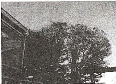
校庭の木々も色づいてきました。

最近朝晩の冷え込みが大きくなってきていますが、日中は穏やかに晴れる日も多く、10月後半から11月は、6年生の修学旅行をはじめ、遠足や校外学習など多くの活動を実施することができました。