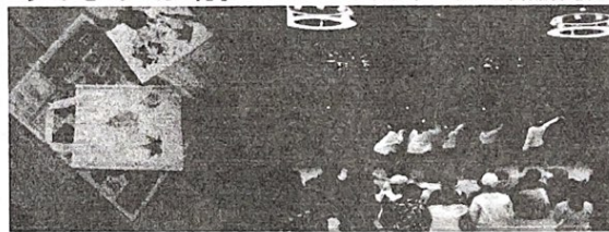
世界で一つだけのエコバック