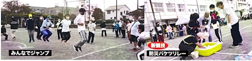
新競技 防災バケツリレー