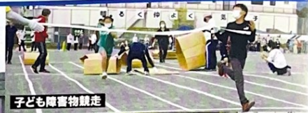
子ども障害物競走