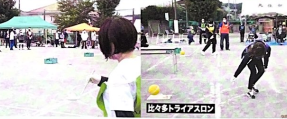
比々多トライアスロン