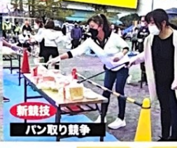
新競技 パン取り競争