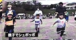
籠子でシュポッポ