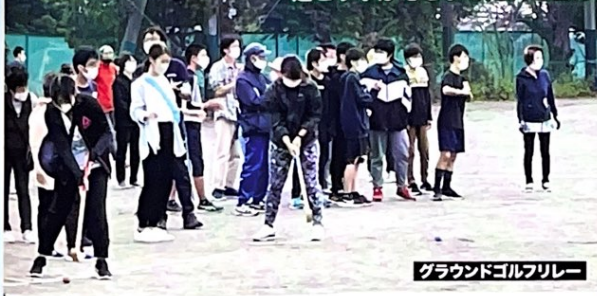
グラウンドゴルフリレー

今年の体育祭は午前中のみで開催でしたが、約300名を超える方々にご参加いただき楽しい時間を過ごす事ができました。ご協力いただいた役員の皆様、ご参加の皆様ありがとうございました。