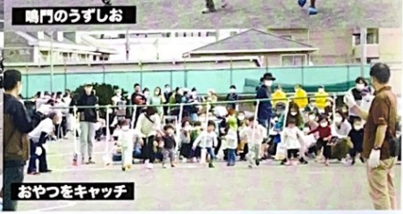
おやつをキャッチ