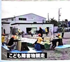
子ども障害物競走