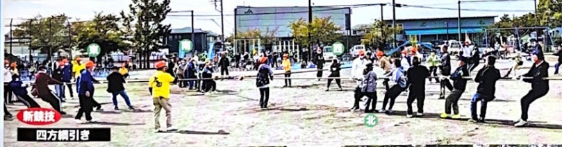
新競技 四方綱引き