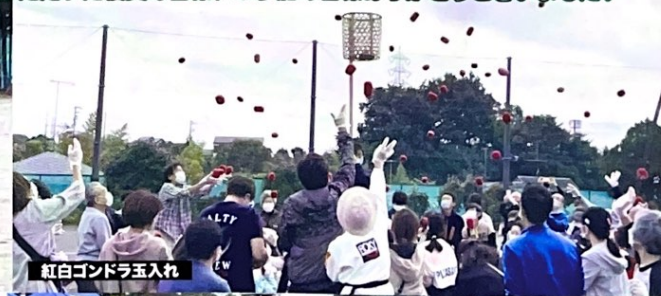
紅白ゴンドラ玉入れ