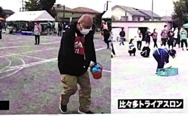
比々多トライアスロン