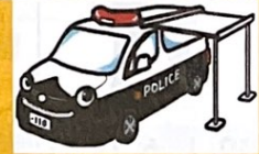
アクティブ交番くん

アクティブ交番は、ワゴン型車両で、交番統廃合後の治安対策として、現在、20の警察署に導入しています。駅前、公園、公民館、学校等で開設し、地理案内、落とし物や相談の受理、児童の見守り活動のほか、機動力を生かしたパトロールも行います。開設場所と時間は、県警ホームページでご覧いただけます。