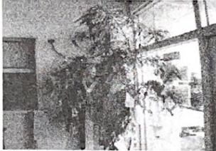
「グリーンボランティア」さん に飾り付けをしていただきました

本日1学期の終業式を行いました。ご家庭や地域の皆様には様々な場面で本校の教育活動にご理解とご協力をいただき誠にありがとうございました。